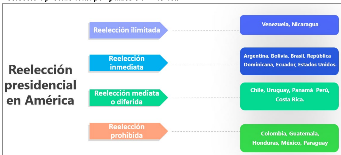
Gráfico 3. Reelección presidencial por países en América

Nota: Elaboración propia según constitución política de Venezuela. Art 230, constitución política de Argentina. Art 90, constitución política de Chile. Art 25, constitución política de Colombia. Art 197, constitución política de Uruguay. Art 152, constitución política de Guatemala. Art 187, constitución